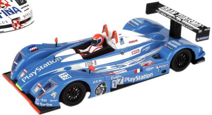
Le Mans prototype