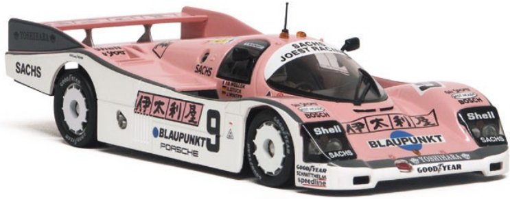
Le Mans Groupe C