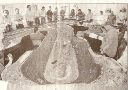
12 Heures de l'ACR 276, samedi 24 et 25 mars, école Pergaud à Saint-Etienne-du-Rouvray. Entrée libre.

La jeune association stéphanoise ACR 276 (Association de circuit routier de Haute-Normandie), créée en octobre 2006, organise demain samedi 24 et dimanche 25 mars, en partenariat avec la Ville et Slot and Go, fournisseur, une compétition d'endurance de slot racing de 12 heures. Les petits bolides engagés, à l'échelle 1/43e, sont des reproductions de voitures de type Le Mans des années 1990. Douze équipes venues du grand Ouest (Le Mans, Nantes, Paris et de Haute-Normandie), dont trois formations de l'ACR 276, s'affronteront sur le circuit de l'école Pergaud.