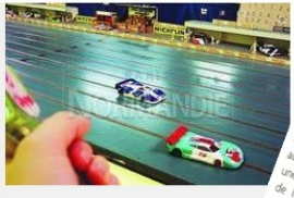
Le départ de la course d'endurance aura lieu à 8 heures.

demain dimanche (l'Association circuit). Le club de circuit organise une course équipes dans son irgaud, sise rue du phanaise, possède le développement des meilleurs nt dire que les d'être de très